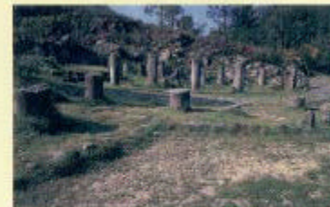
Os Milenarios situados o lado da Calzada Romana ou Vía Nova

Poderá dar un paseo por toda veira do río e en menos de media hora atopará excavacións, coas minas de época. Dos Romanos, e fervezas da (Fecha) os marcos milenarios, a vía romana que unía "Astorga e Braga", e varias rutas de sendeirismo, todo isto sen precisar de coiler o coche.