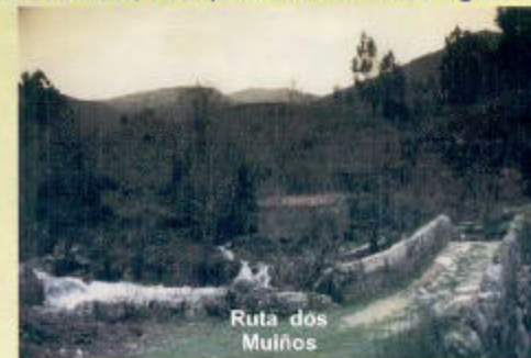
Ruta dos Muíños

Afora merendeiro privado onde vostede pode preparar unha barbacoa ou calquera outra cousas, e compartir coa familia ou amigos.