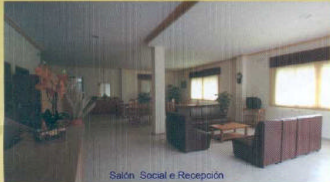
Salón Social e Recepción