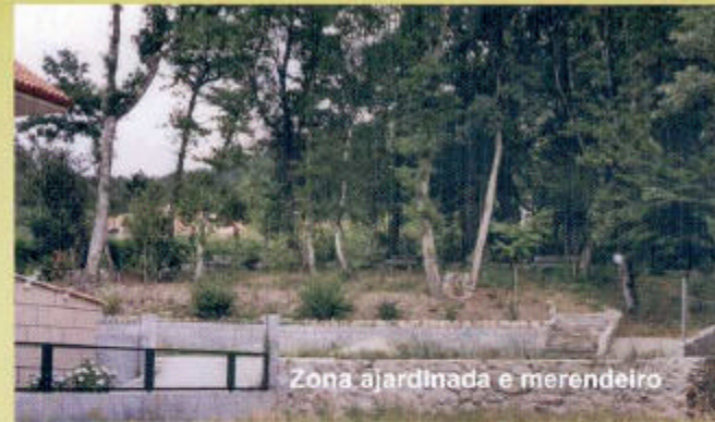
Zona ajardinada e merendeiro

Afora merendeiro privado onde vostede pode preparar unha barbacoa ou calquera outra cousas, e compartir coa familia ou amigos.