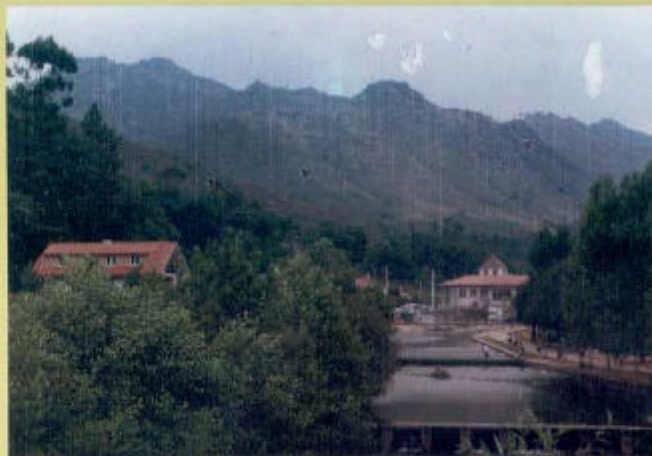
No corazón do Parque Natural Baixa Limia Xerra do Xurés*

Os Baños - Riocaldo - Zona Vila Termal - 32895 LOBIOS (Ourense) España Telf.: 988 44 82 84 - Móbil.: 627 91 35 35